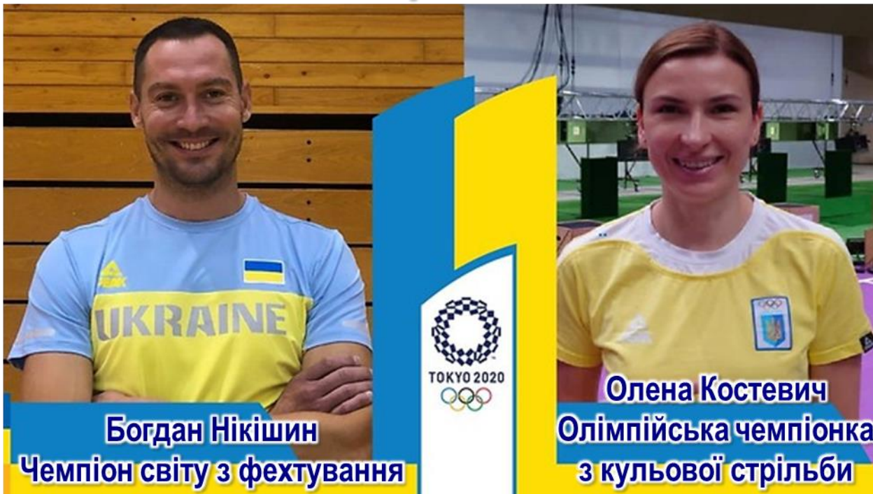
Богдан Нікішин Чемпіон світу з фехтування