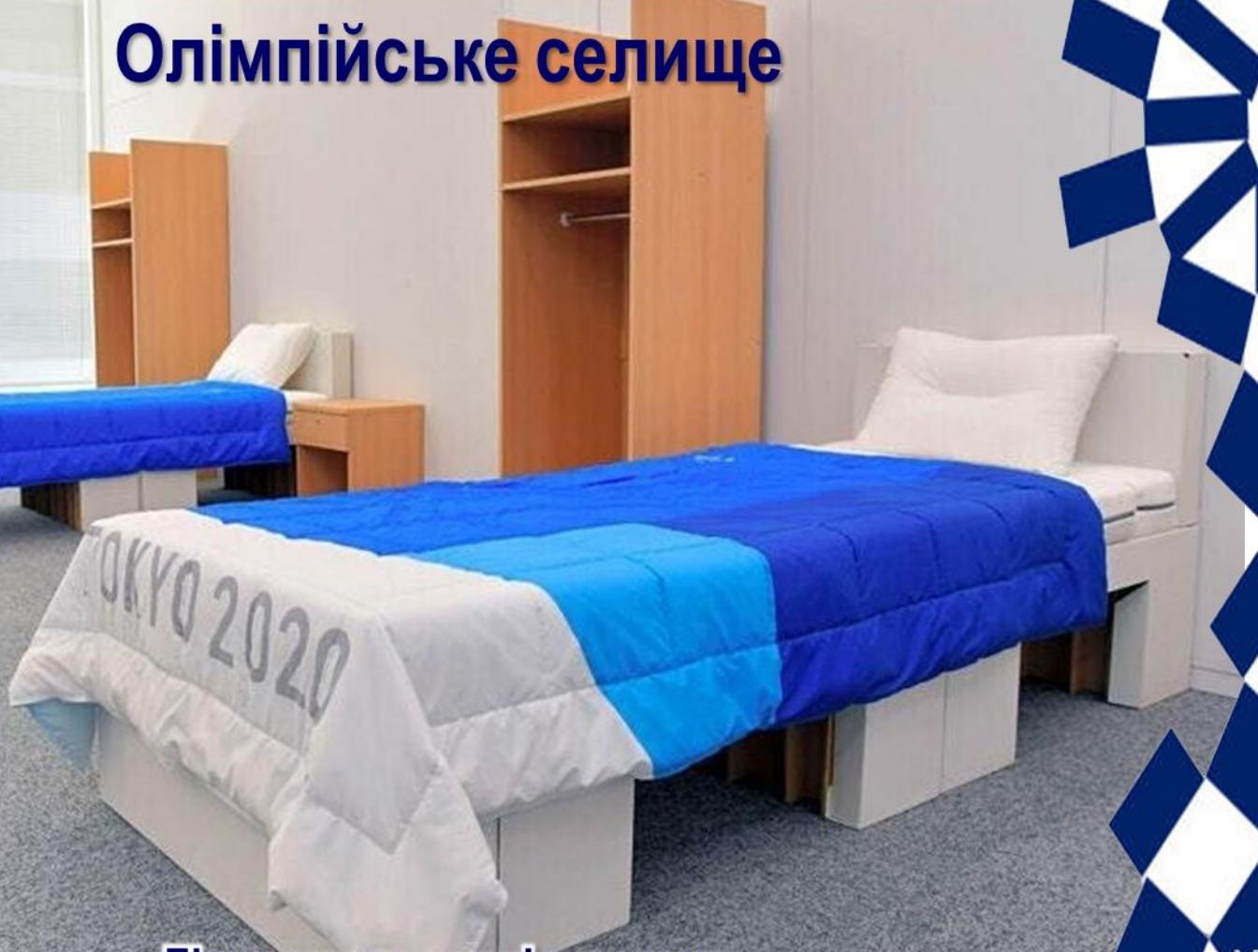
Ліжка виготовлені з картону