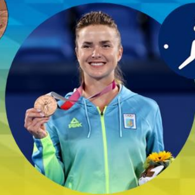
ЕЛІНА СВИТОЛІНА ТЕНІС